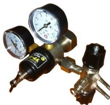
Рис.1 Редуктор УР-6П