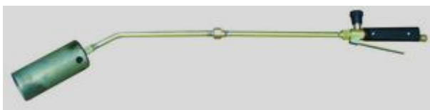
Рис.2 Горелка модели ГВ ДЖЕТ 119-32