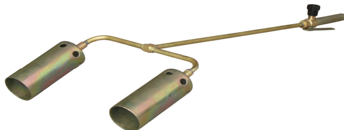
Рис.3 Горелка модели ГВ ДЖЕТ 119-20

4.2 Принцип работы горелок - инжекторный. Дозирующий газовый жиклер расположен в основании наконечника. Горючий газ через жиклер попадает в наконечник и через боковые отверстия засасывает воздух для образования смеси. Образовавшаяся смесь сгорает, образуя пламя на выходе из наконечника.